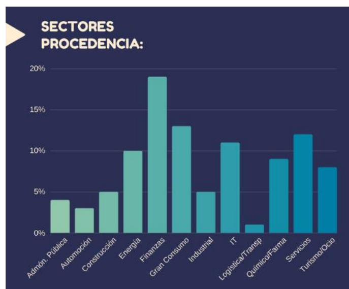
Gráfico 3. Sectores de procedencia de los candidatos recolocados

Le sigue el sector del Gran consumo, del que llega el 13% de los candidatos. Ya en tercer, cuarto y quinto lugar, el sector servicios, cuyos candidatos suponen el 12% del total, el sector de IT, con un 11%, y el energético, con un 10%. Por debajo del 10% se encuentra el sector Químico-Farmacéutico (9%), mientras que un 8% procede del sector del Turismo-Ocio. Menos presencia tienen los trabajadores que vienen de sectores como la Industria y la Construcción (ambas con un 5%), la Administración Pública (4%), y la Automoción (3%). El sector que menos candidatos genera es, por tanto, el de Logística y Transporte, del cual solo procede el 1% de los recolocados.