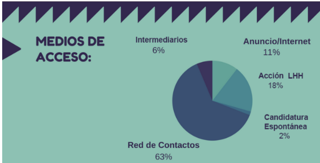
Gráfico 4. Medios de acceso al mercado laboral por parte de los candidatos recolocados