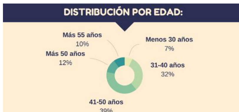
Gráfico 2. Distribución de candidatos recolocados por edad

En segundo lugar, se encuentran las personas de entre 31 y 40 años, que conforman el 32% de los recolocados. Al mismo nivel se sitúan los mayores de 50 años, que suponen un 32% sobre el total. En último lugar, el grupo menos numeroso de candidatos es el que comprende a las personas menores de 30 años y que alcanza el 7%. Este año, por tanto, la edad media del candidato de Lee Hecht Harrison en sus programas de recolocación se sitúa en los 43 años , la misma que el pasado año.